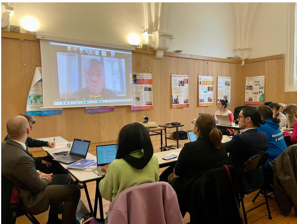
Groupe de travail sur la réciprocité – Atelier d'enrichissement