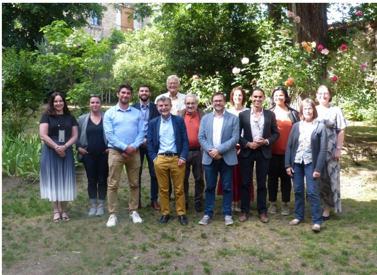
Assemblée Générale du CLONG-Volontariat 2022

Au cours de l'année 2022, le Conseil d'Administration s'est réuni 5 fois, l'Assemblée générale une fois et le Bureau à 12 reprises.